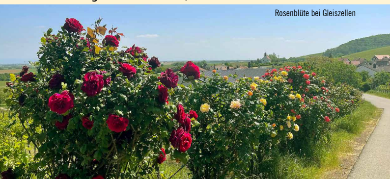
Rosenblüte bei Gleiszellen

Schöne Tages-Wanderung durch eine Wein- und Waldlandschaft Länge ca. 13 Kilometer, Wanderzeit ca. 3 Stunden