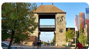
Deutsches Weintor · Schweigen www.weintor.de