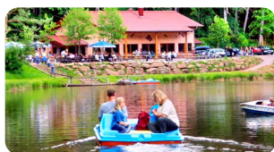
Paddelweiher-Hütte Hauenstein www.paddelweiher.de