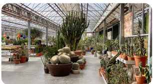
Kakteenland Steinfeld www.kakteenland.de