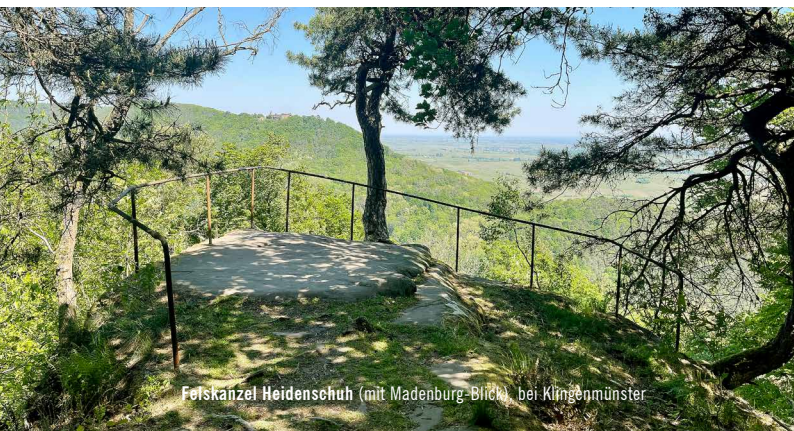
Felskanzlel Heidenschuh (mit Madenburg-Blick) bei Klingenmünster

Nähere Informationen zu allen Sehenswürdigkeiten und Ausflugszielen im Bad Bergzaberner Land erhalten Sie unter www.bad-bergzaberner-land.de