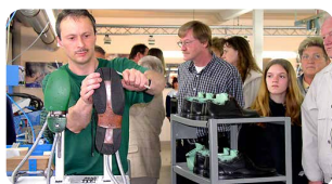
Gläserne Schuhfabrik · Hauenstein www.glaeserne-schuhfabrik.de