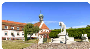
Liebfrauenberg Bad Bergzabern