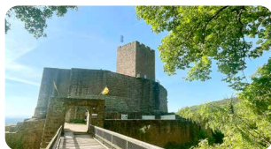
Burg Landeck www.landeck-burg.de