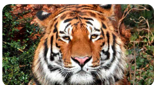
Zoo Landau www.zoo-landau.de