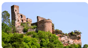
Dahner Burgen · Dahn www.dahner-felsenland.de