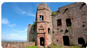
Burgruine Madenburg www.madenburg-pfalz.de