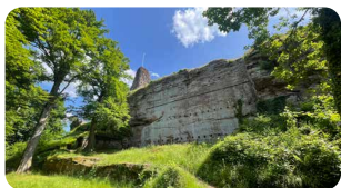
Burgruine Guttenberg www.oberotterbach.de