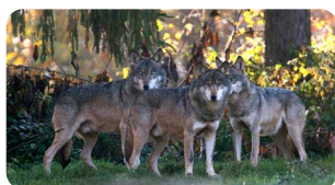
Wild- und Wanderpark Silz www.wildpark-silz.de