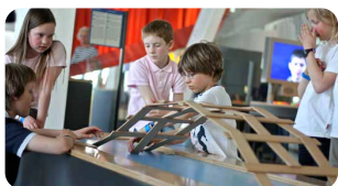
Dynamikum Pirmasens www.dynamikum.de